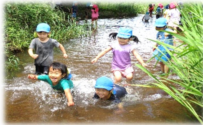
地域の自然に触れて遊ぶ < 保育所運営事業 >