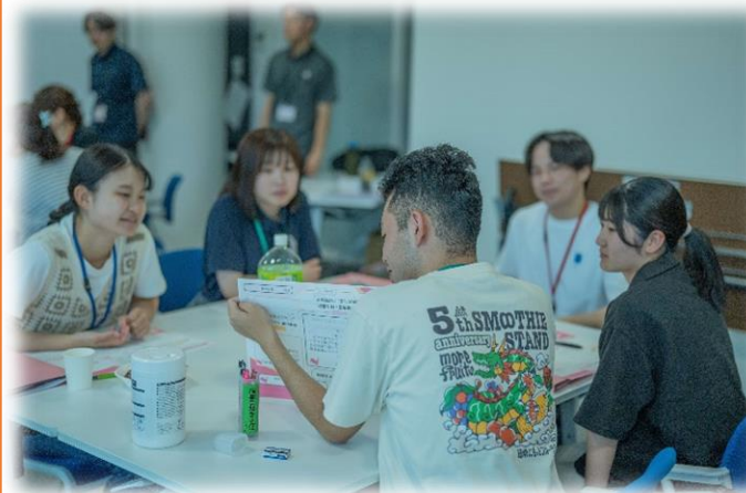
自身のチャレンジを共有する大学生 <雲南コミュニティキャンパス事業>