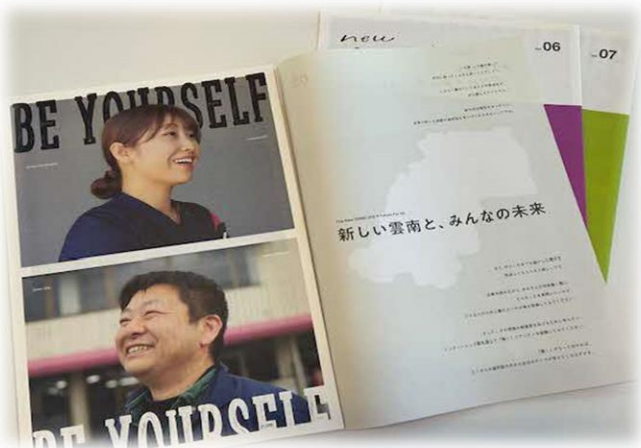
市内で働くロールモデルなど掲載した情報誌 <高校卒業生とのつながり創出事業>