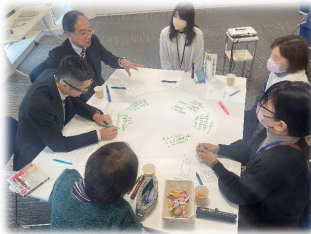
地域の取組座談会 <持続可能型地域推進事業>