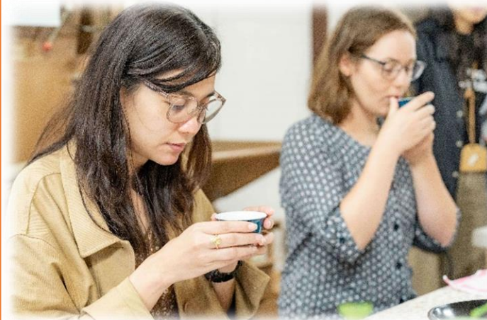
体験メニューを楽しむインバウンド客 <雲南市観光協会補助金>