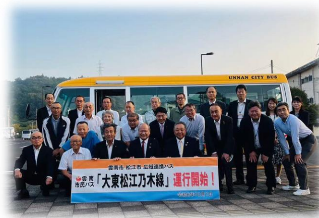
R6.10月から「大東松江乃木線」運行開始 <市民バス運行事業>