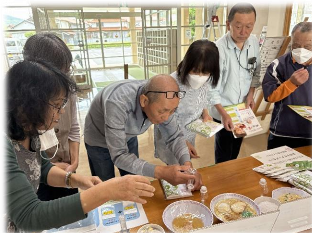
塩分ひかえめは、愛情の新しいカタチ うんなん愛の減塩プロジェクト事業<保健事業>