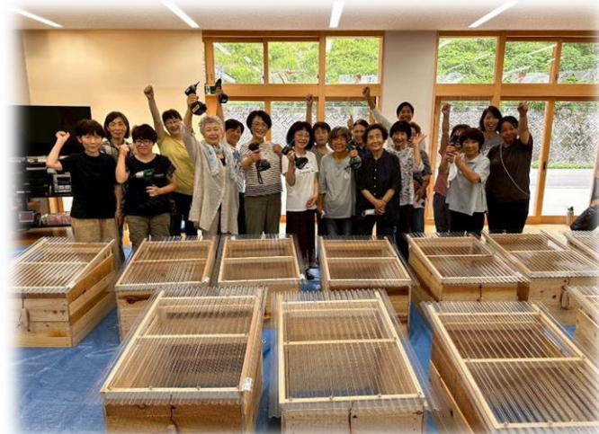
キエーロコンポストの製作風景 <脱炭素社会構築推進事業>