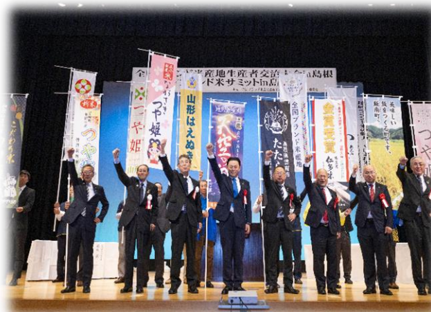
全国ブランド米産地生産者交流大会in島根 <ブランド米推進作付支援事業>