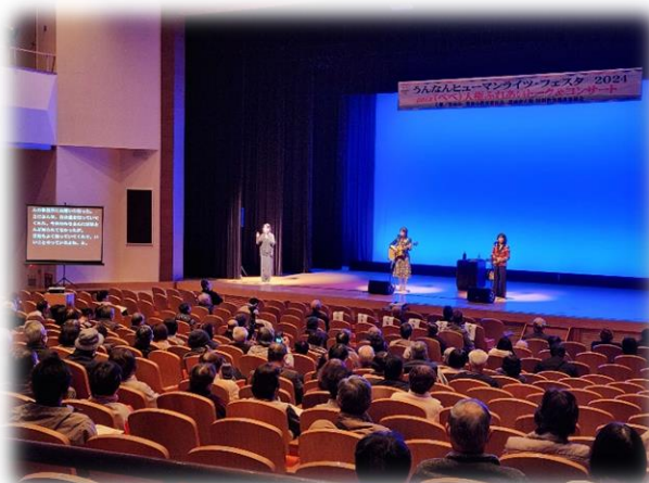
ヒューマンライツ・フェスタ2024 <地域人権啓発活動活性化事業>