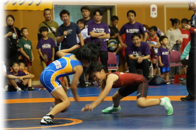
雲南市長杯少年少女レスリング選手権大会 <国民スポーツ大会・全国障害者スポーツ大会事業>