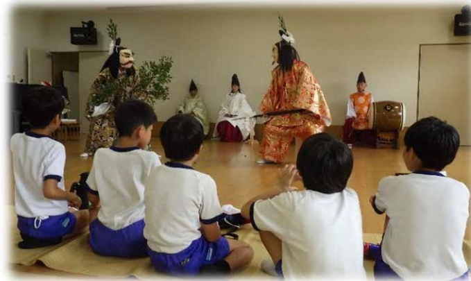
ふるさとの伝統文化を学ぶ子どもたち <地域とともにある学校づくり推進事業>