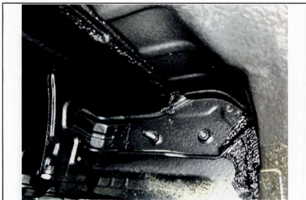
塗装完了後（後方部）