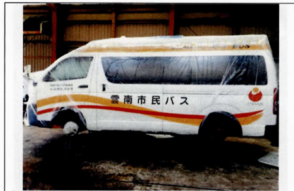
塗装完了後（車両全体）