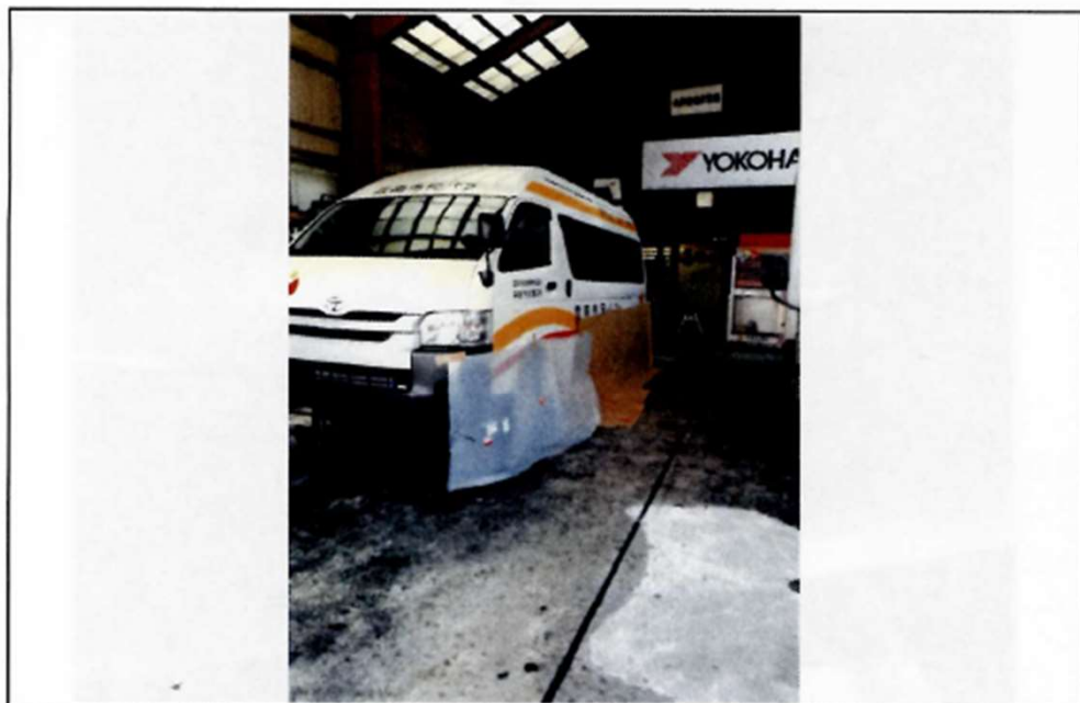
塗装完了（車両塗装部乾燥状況）