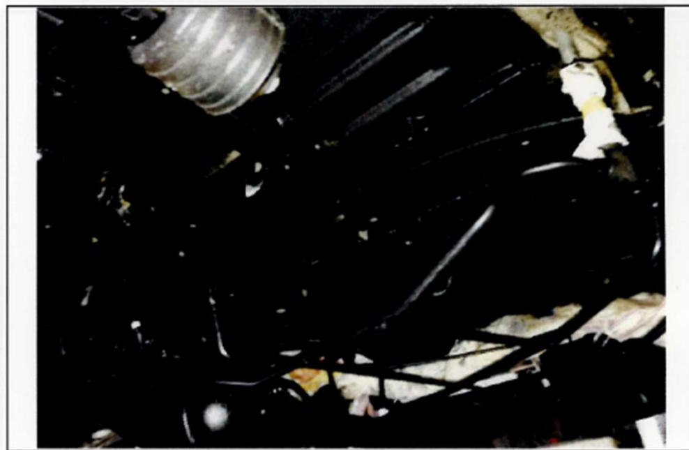
塗装完了後（後方デフ後側・入マヤヤ格納部床下部分）