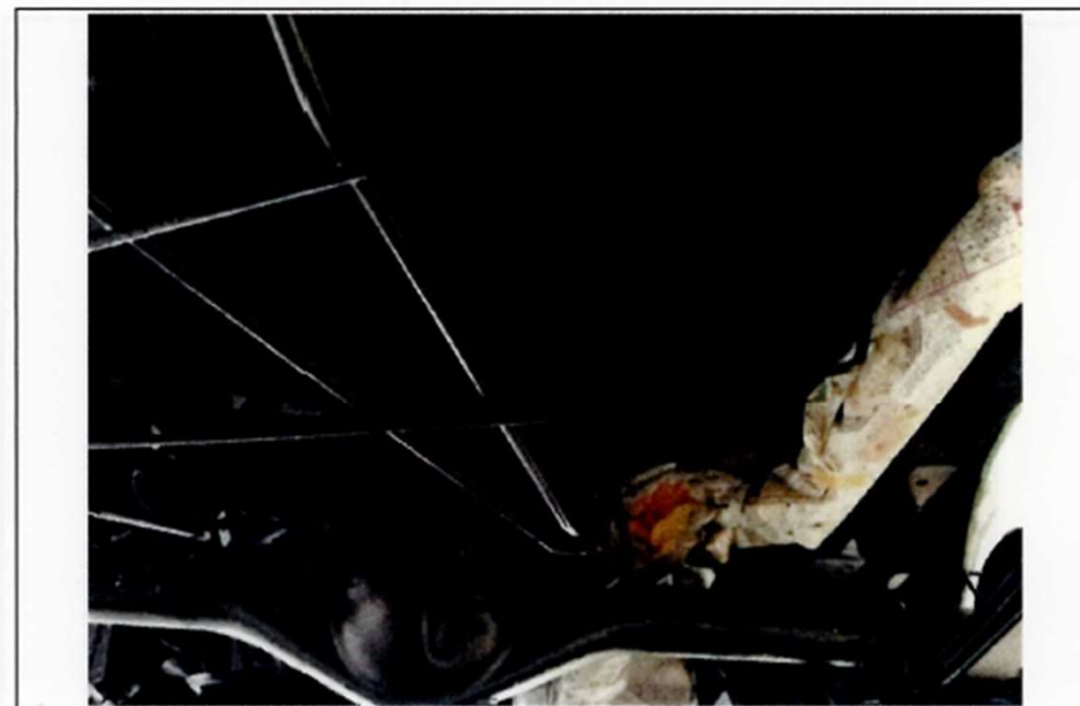
塗装完了後（後方デフ上部床下部分）