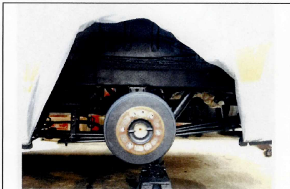
塗装完了後（左下・タイヤハウス部分）