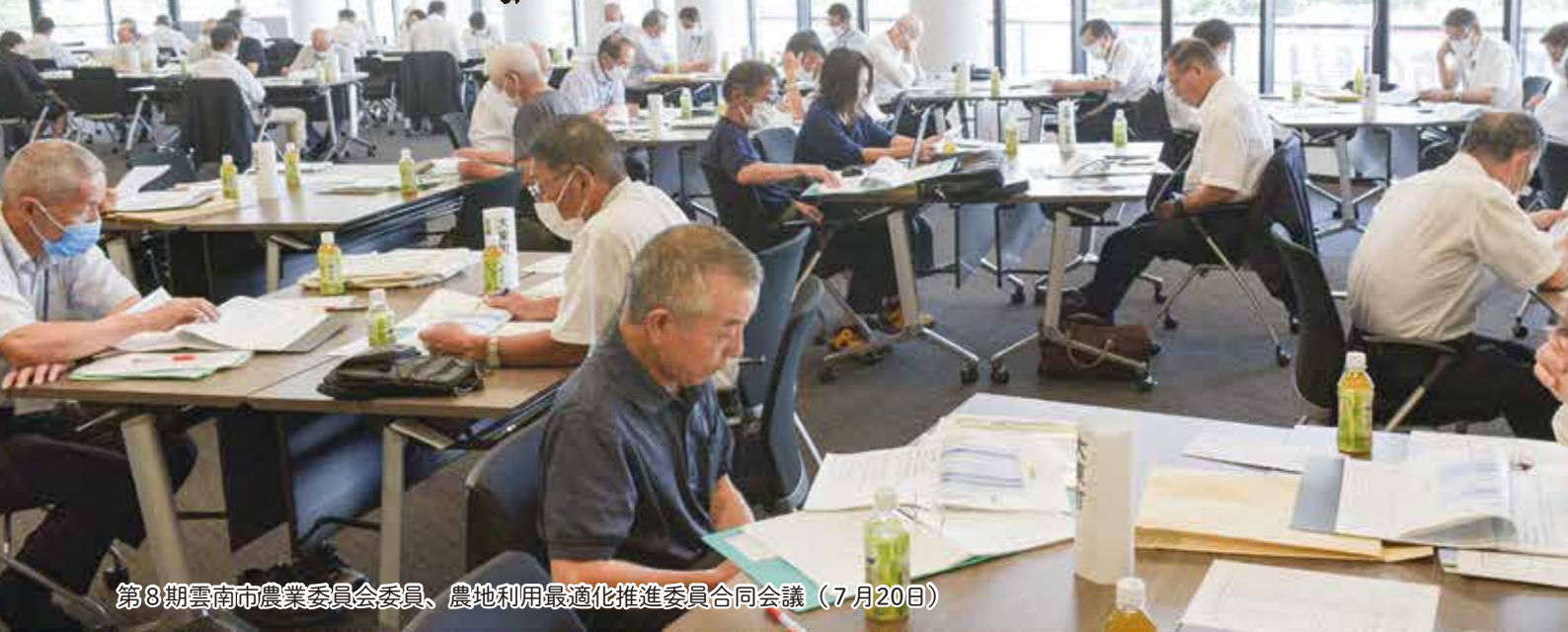
第8期雲南市農業委員会委員、農地利用最適化推進委員合同会議（7月20日）