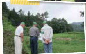
農地パトロールの様子

遊休農地は、雑草や害虫の発生で周辺に迷惑を与えるばかりでなく、不法投棄や火災を招く恐れもあります。農地をお持ちの方は、日頃から適切な維持管理に努めてください。