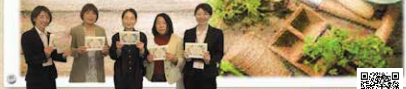
雲南市農業委員会女性委員

キッチンにちょっとあったらいい野菜、手軽に作れる野菜など作ってみませんか？ 第2弾は移住者さんからのおすすめ活用も紹介しています。 家庭菜園ビキナーにおすすめする「調理にすぐに使えて、あると便利よ！」とキッチン目線で作成しました。