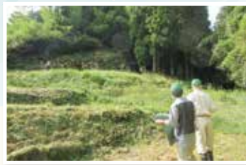
昨年の農地パトロールの様子