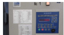
環境制御盤の導入