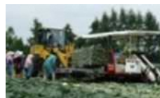
機械化体系の導入