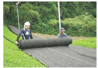
茶の被覆作業の実施