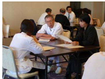
(※写真はイメージです)