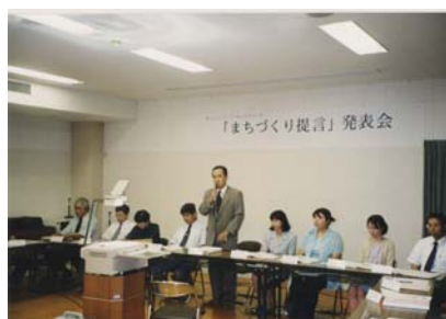
(※写真はイメージです)