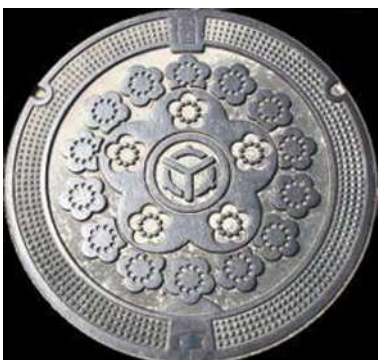
⑧ 三刀屋町 農業集落排水 梅・町章