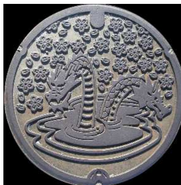
⑫ 木次町 農業集落排水 湯村 大蛇・桜・温泉