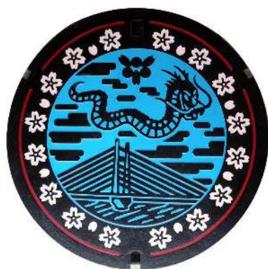
⑨ 木次町 農業集落排水 西本郷 木次大橋・大蛇・桜・ シンボルマーク