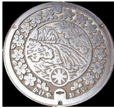
21 掛合町 農業集落排水 八重滝・さつき・町章