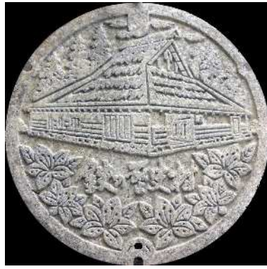
⑲ 吉田町 農業集落排水 菅谷山内・つつじ (石張り)