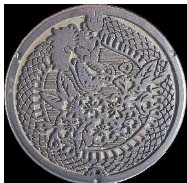
⑬ 木次町 農業集落排水 日登・大島引野 大蛇・桜