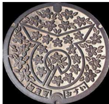
⑦ 加茂町 特定環境保全公共下水道 町章・つつじ