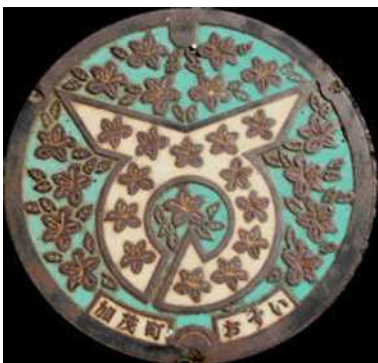
⑥ 加茂町 特定環境保全公共下水道 町章・つつじ