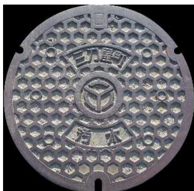
⑰ 三刀屋町 農業集落排水 上熊谷 町章