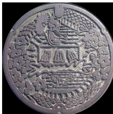
⑭ 木次町 農業集落排水 平田 大蛇・桜・尾原ダム