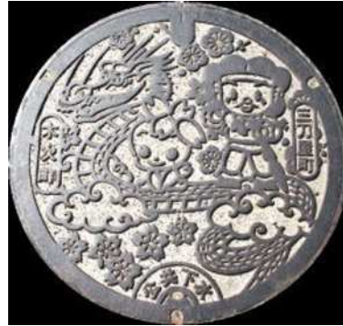
② 木次町・三刀屋町 公共下水道 チェリーちゃん・みこと君 大蛇・桜・梅