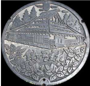
⑳ 吉田町 農業集落排水 菅谷山内・つつじ