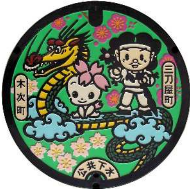
① 木次町・三刀屋町 公共下水道 チェリーちゃん・みこと君・ 大蛇・桜・梅