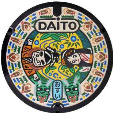
④ 大東町 特定環境保全公共下水道 スサノオくん・イナタ姫 蛭・大蛇