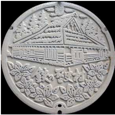
⑱ 吉田町 農業集落排水 菅谷山内・つつじ (カラー)