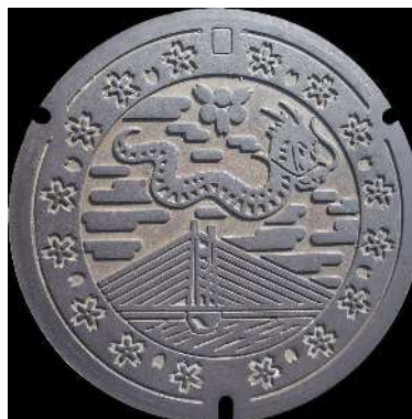
⑩ 木次町 公共下水道 桜が丘・塔の村東 農業集落排水 西本郷