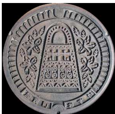
⑮ 加茂町 農業集落排水 加茂北 銅鐺・つつじ