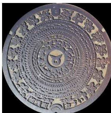
⑯ 加茂町 農業集落排水 銅鏡・つつじ