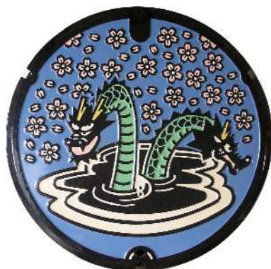
⑪ 木次町 農業集落排水 湯村 大蛇・桜・温泉