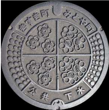
③ 木次町・三刀屋町 公共下水道 桜・梅