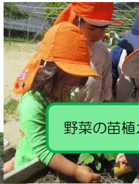
野菜の苗植えしたよ！