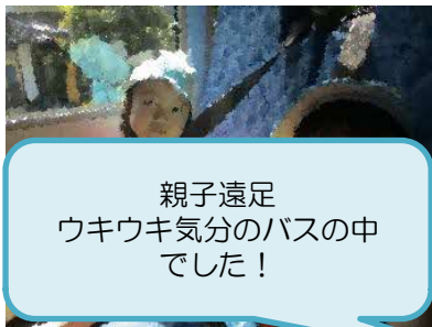
親子遠足 ウキウキ気分のバスの中 でした！