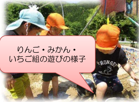
りんご・みかん・ いちご組の遊びの様子