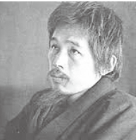
永井隆博士（医学博士、随筆家） 雲南市三刀屋町出身