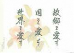
上代タノ氏（日本女子大学第 6 代学長） 雲南市大東町出身

【目指す人物像～ふるさとの偉人～】 「故郷を愛す 国を愛す 世界を愛す」「如己愛人」 の精神を身に付けた人づくり