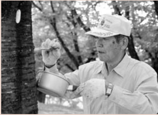
夏場はコスカシバという害虫の駆除も行います。

桜守の使命は、3月下旬から花開く素晴らしい景観を次世代に引き継ぐことだと思っています。