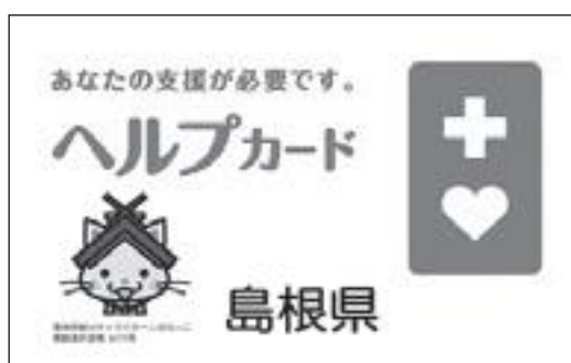
ヘルプマークとヘルプカード