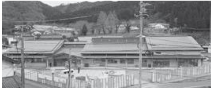
新築中の掛合総合センター・掛合交流センター