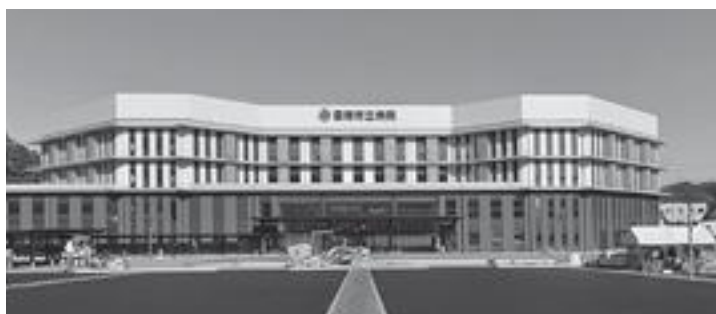
完成間近の市立病院

指定管理者の指定は、公募により競争原理を働かせ、透明感のある運営をするべきではとの問いに、公募者選定委員会での実績等をチェック、評価をして選定しているとの答弁でした。公募者選定委員会は原則非公開とされていますが、透明性の確保のため公開とするよ