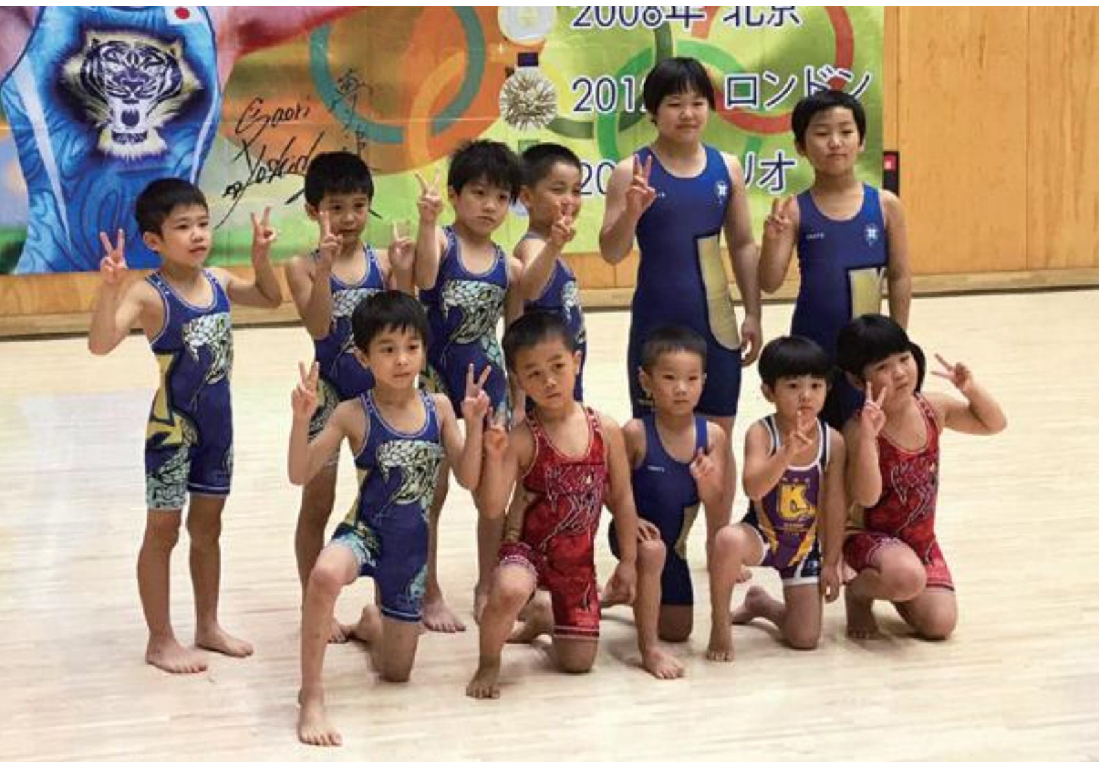
Yu-Gaku 加茂スポーツクラブ レスリング部