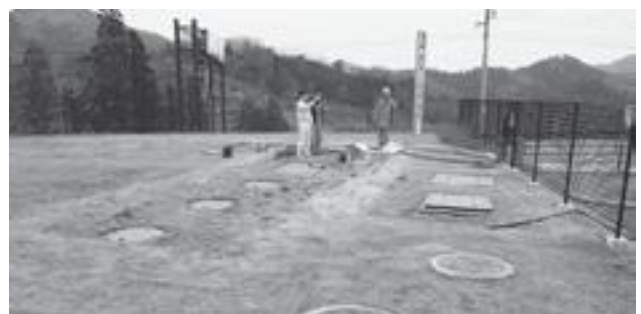
たたらば壺番地浄化槽

・道の駅たたらば壺番地整備事業950万円の増額については、浄化槽の改修を後処理から前処理施設に変更することに伴う工事費の増によるものです。この整備は、9月補正で275万円を増額補正したばかりであり、整備計画について十分に関係機関等との調整がされていないことが原因です。今後このようなことが生じないように強く申し入れをしました。