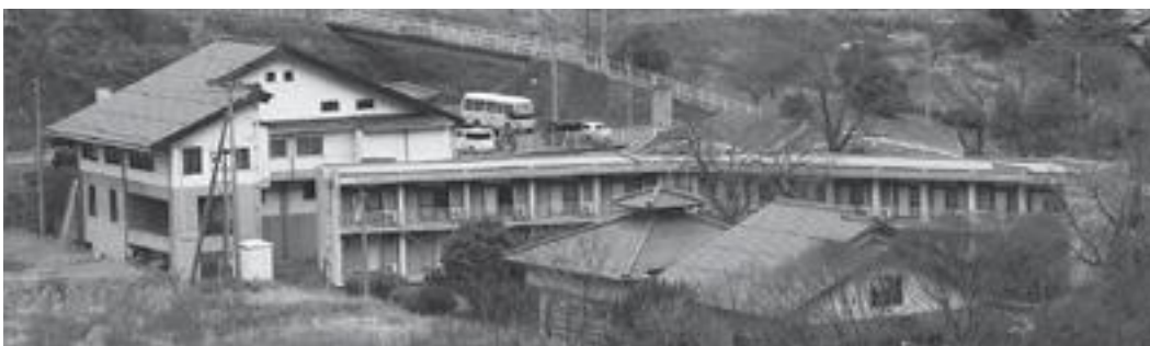
改築予定の清嵐荘

600万円、施設用地の取得費を332万円増加し、電柱移転補償に205万円を充てるとの答弁でした。