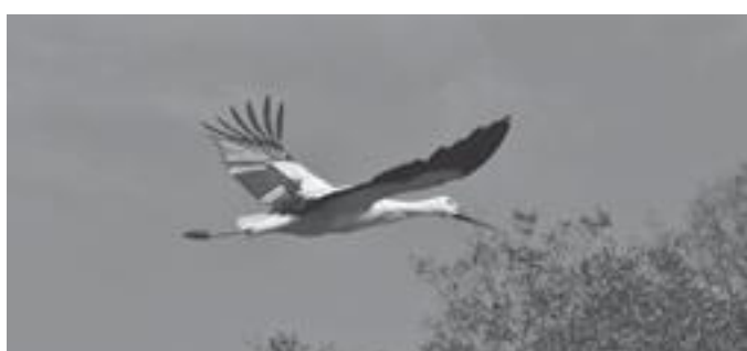
市内を雄飛するコウノトリ

問 コウノトリの住みやすい環境づくりが急務だ。保護対策としてどのような施策を考えているのか。 答 国交省が行っている生息分布、環境、動向等