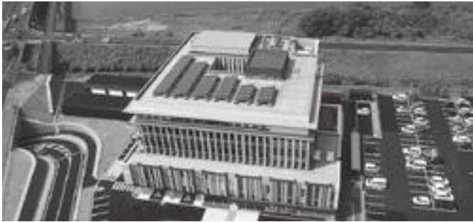
市役所屋上の太陽光パネル