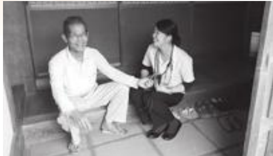
地域自主組織による見守り活動

この条例は、平成22年に設置した特定目的基金の設置条例の一つです。平成28年度に8,076万円余りを取り崩し、地域づくり活動等交付金へ充当したため、基金残高が無くなったことに伴い、同基金を廃止するものです。質疑では、今後、必要があれば再び設置できるか。また、過疎債の総額を市の裁量でハードとソフトに分けられるのかとの問いに、必要な事態が生じた場合は、改めて条例を設置する。ソフトの発行限度額は、標準財政規模や財政