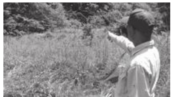
農業委員による農地パトロール

事務と定められたことから、担当地域における農地パトロールなど現場活動を農業委員と協力して行う。業務内容の割り振りや進め方については、