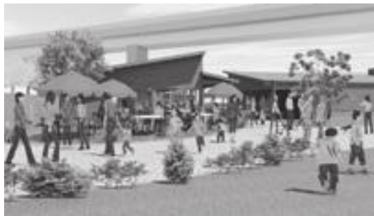
商業集積施設のイメージ図