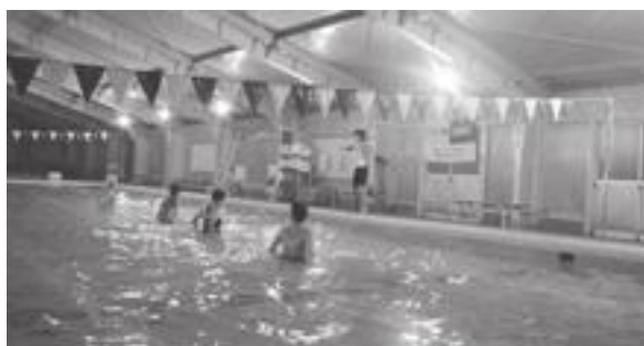
温水化に改修されるB&Gプール