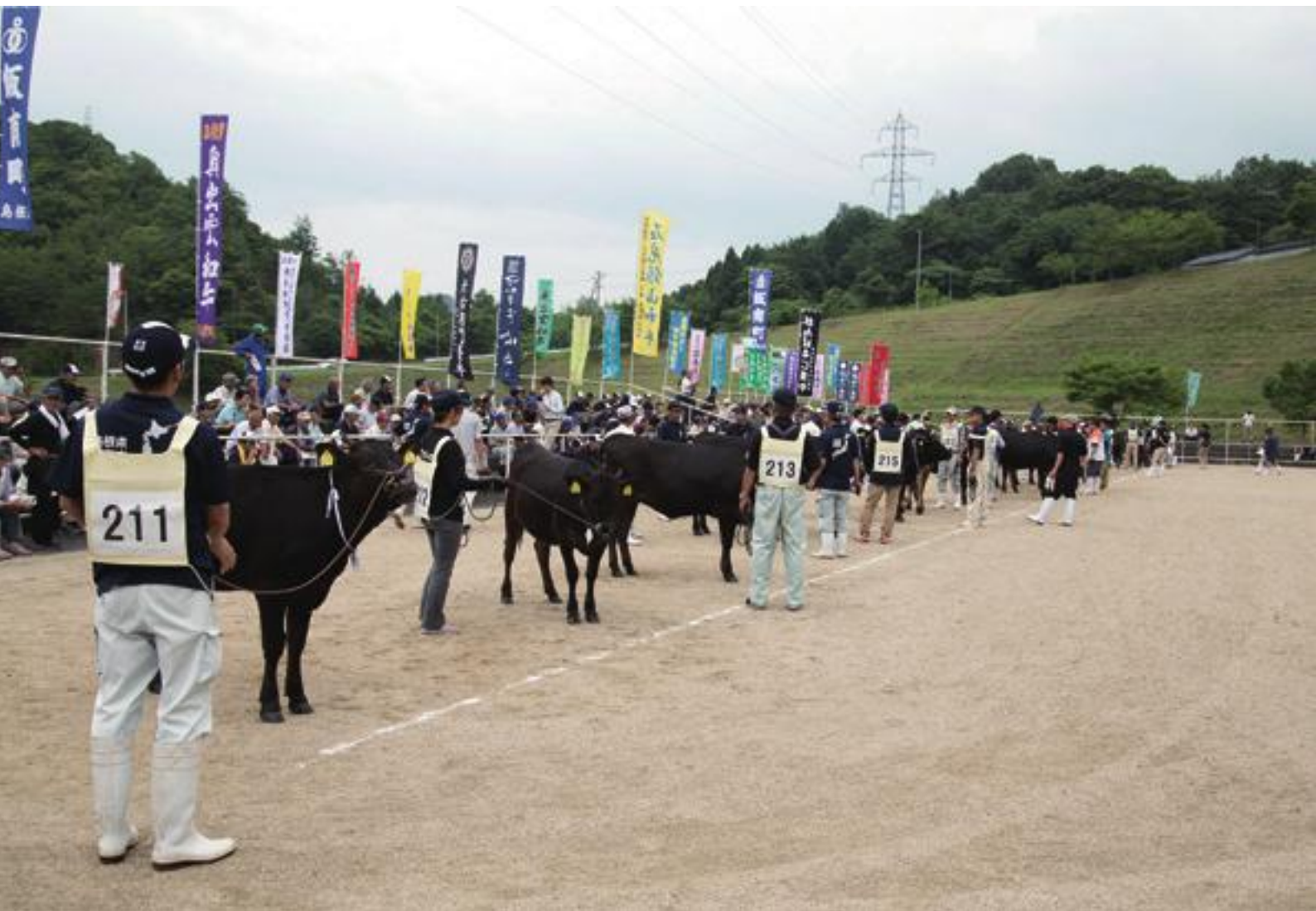
全国和牛能力共進会 島根県代表選抜会