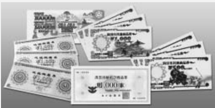
一般質問でも多くの意見が出されたが…