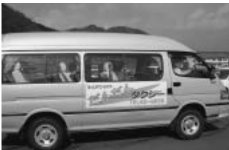
掛合で運行中のデマンド型バス

の高齢者など交通弱者を地域で移送支援する手段に、地域自主組織や自治会活動の考えはどうか。 政策企画部長 実現には民間事業者との調整や、さまざまな角度での検討が必要だ。市の公共バスを見直し、デマンド型運行を検討する方向であるが、要望があれば協議には応じたい。