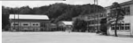
新築立て替えが待たれる三刀屋中学校