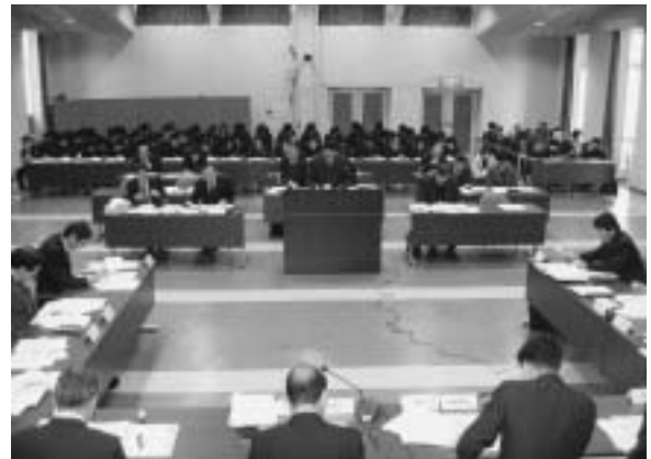
教育民生常任委員会を傍聴する木次中3年生