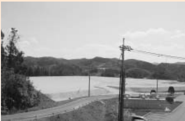
造成工事が完了した山方企業団地

公の施設の指定管理者の指定1件、雲南市有林の信託1件、市道の路線認定（2路線）、市道の路線変更（3路線）が提案され、いずれも全会一致で原案のとおり可決すべきものと決しました。