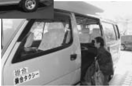
玄関先まで送迎が可能です