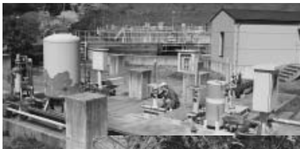
施設の老朽化が進んでいるし尿処理場

教育長 平成21年度中に基本計画をまとめた。答申を尊重する形となる。財政効率の面からではなく、子供の育ち、子供の学びの視点から基本計画を策定する。地域での合意形成は重要であり、保護者、地域住民、学校関係者等徹底して話し合う。