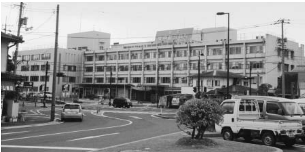
市立病院化に向けて動き出した公立雲南総合病院

雲南市議会では、公立雲南総合病院の充実強化を図ることを目的とし、平成19年1月公立雲南総合病院充実強化雲南市議員連盟を設立。地域住民の健康と命を守り、安心して生活している地域の中核病院としての充実強化にむけ取り組みとしています。