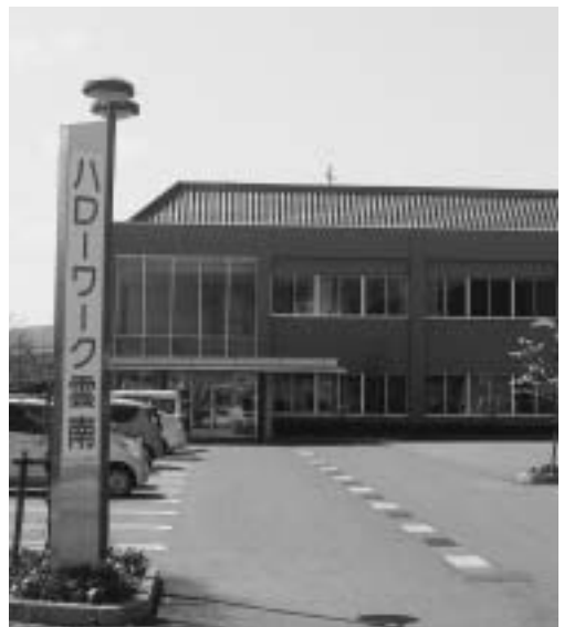
市の無料職業紹介所とハローワークとの連携を