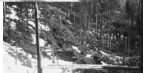
悲鳴をあげる杉林