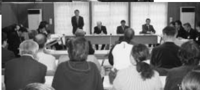
地域自主組織との意見交換