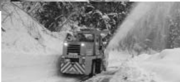
困難を極めた除雪作業