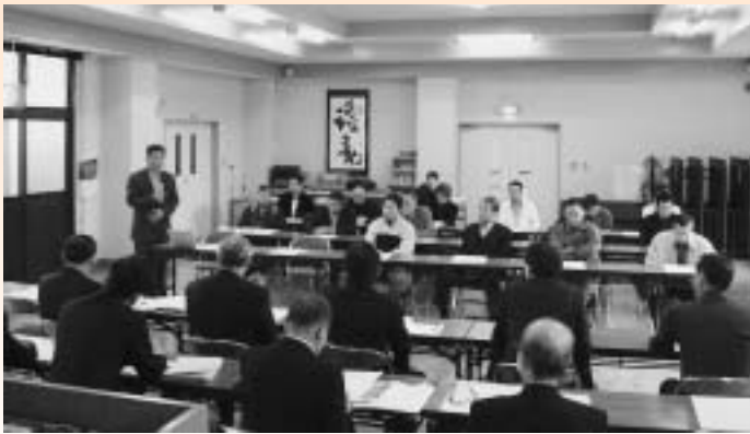
地元組織との意見交換会

において、地域自主組織とダム周辺地域活性化協議会の役員の方々とも意見交換を行い、現状、今後の取組み等について意見を聞かせていただきました。この意見交換会は今後とも必要に応じて都度開催することで、それぞれの団体とも確認いただきました。