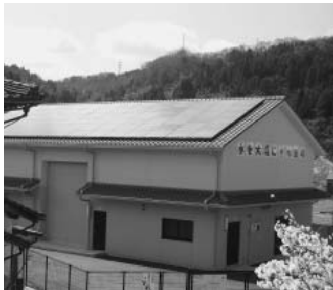
世界的に注目される太陽光発電

問い 太陽光発電導入補助金が、減額されているが、本年度は何台の設置を計画されているか。