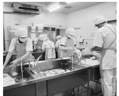
地産地消の食材で調理をしている職員

発電所構内では、カメラの撮影は事前登録1台のみが許され、構内の出入り時には、事前に提出した名簿と運転免許証との照合、金属探知機によ