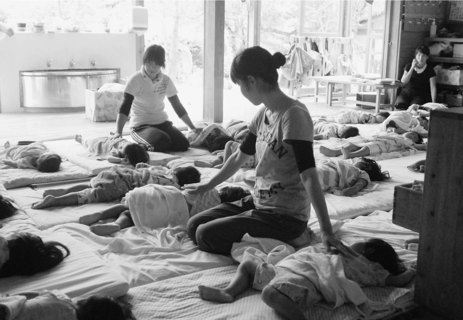
雲南市版の子ども子育て支援の充実を