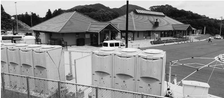
仮設トイレで応急処置をし、ポンプ槽設計が計画された道の駅「たたらば壱番地」

応として、浄化槽原水ポンプ槽設置工事1,000万円を補正するものです。トイレの問題は抜本的な対策が必要との質疑に対し、今後状況を見ながら増設を含め検討するとの答弁がありました。