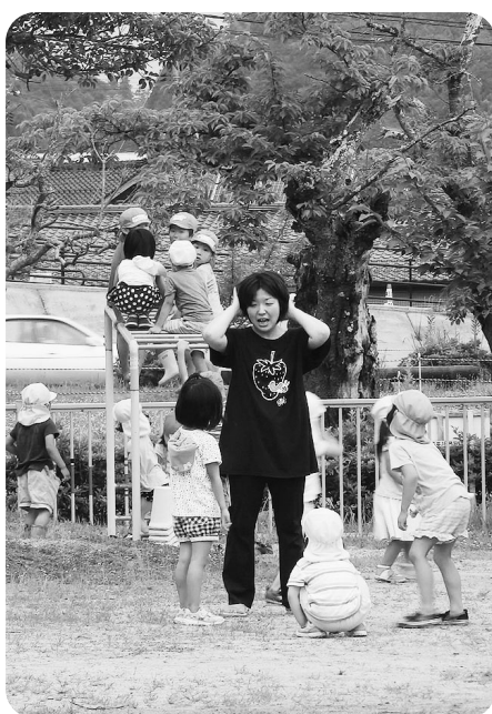
お迎えを待つ子ども達

市営住宅等の指定管理者制度及び管理代行制度導入に伴う住宅システムオンライン化経費