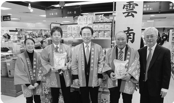
昨年の台湾で開かれた物産展

市内事業者の皆さんによる農産加 工品の海外販路を開拓するために、 7月に台湾で開催される「日本フェ ア in 台湾」への出店支援事業費