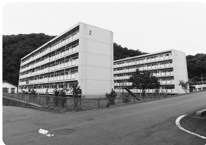
市が取得した3ヶ所のうちの1つ雇用促進住宅木次宿舎