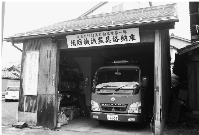
現在の消防格納庫

大東方面隊消防機庫移転工事に係る補正予算935万円は、当初予算後、わずか3か月で補正の提案がありました。補正計