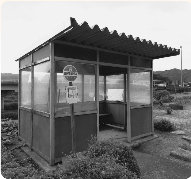
改修予定の加茂町下神原バス停

公共建築物の小規模な 営繕を行うことで施設 の長寿命化を図るとも に利用者の利便性と 快適性の向上を図る。 また、大工・左官業な ど小規模な事業者へ発 注することで経済の活 性化を図るための小規 模修繕事業費