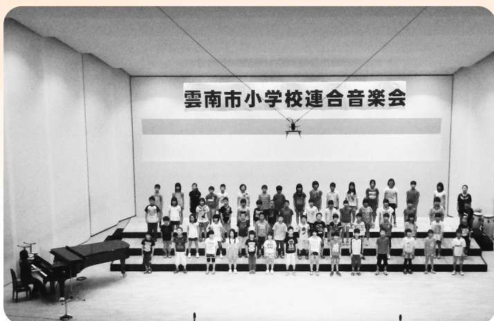
雲南市の歌が完成し、各学校で歌われるのが待ちどおしい音楽会風景

市政施行10周年記念事業の一環として制作する雲南市の歌の歌詞公募、作曲、音源作成経費 290万円