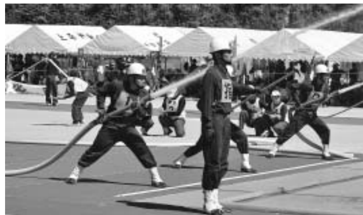
ポンプ車の部（大東方面隊）の消防操法