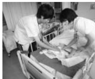
▲病棟での看護体験