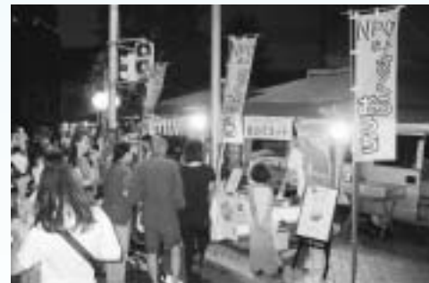
出店は多くのお客さんで賑わいました

尾原ダムを有する斐伊川上流部の雲南市・奥出雲町と、下流部の松江市との交流を目的として、7月24日、25日の両日、松江市の白潟本町納涼祭に参加しました。