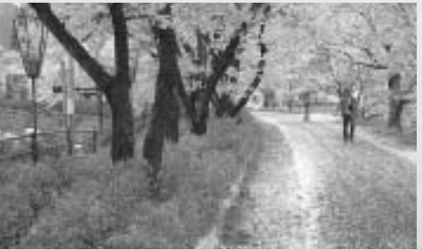
上は満開の桜、下はムラサキハナナツと一面の落花。この時期が最高

【手入れワンポイント】 植栽準備 日当たりと水はけの良い広い場所を選び、堆肥等を入れ、深く耕しておきます。植えるのは11月から3月です。