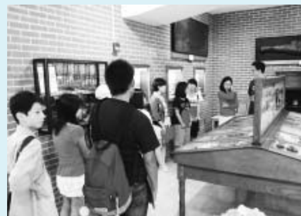
アラム大学のキャンパスを見学しました