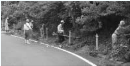
暑い中での草刈り作業でした

国土交通省が定める「森と湖に親しむ旬間」に合わせ、さくらおろち湖周辺の環境美化活動を実施しました。当日は、尾原ダム管理支所、島根県、雲南市、奥出雲町、NPO法人さくらおろち、温泉活性協・ダム湖の郷を中心に地元住民の約50人の参加により、さくらおろち湖沿線市道や展望台の草刈り、空き缶拾い等を行いました。非常に暑い中での活動でしたが、それぞれ熱心に活動を行い、たくさんの汗を流しました。さくらおろち湖周辺の景観保全の大切さを考える機会ともなり、有意義な活動となりました。