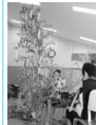
七夕飾りが完成しました

が参加し、楽しいひと時を過ごしました。初めに、参加した子どもたち全員がそれぞれの願いごとを短冊に書き、七夕飾りが完成しました。短冊には、「ピアノが上手に弾けますように」、