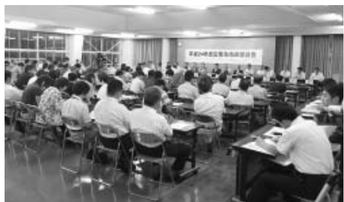
掛合会場での市政懇談会

市政懇談会の報告書は、まとまり次第、地域自主組織等へお送りします。あわせて、各総合センターや情報政策課で縦覧するとともに、雲南市ホームページに掲載します。