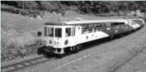
トロッコ列車「奥出雲おろち号」

市内観光地や地域の旬な情報をシリーズで紹介していきます。大手旅行代理店の担当者に出雲エリアの観光資源について尋ねると、まず出雲大社、次いで松江城周辺と宍道湖、玉造温泉、足立美術館、そして木次線走るトロッコ列車「奥出雲おろち号」の名前が出てきます。スタートから15年目を迎えた「奥出雲おろち号」の乗客は延べ25万人を超え、鉄道ファンのみならず、ゆったりとしたスローな旅を楽しみたい層に着実に浸透し、最近では東京方面からの個人旅行者の姿が目立つようになりました。