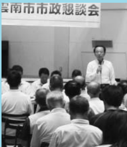
市政懇談会であいさつする速水市長（7月12日、ラメール）

その上で、将来、原発に頼らず、危機管理が行き届き、医療環境が整った安心安全なまちづくり、雇用の場があり、教育環境が整った、地域自主組織が躍動する活力と賑わいのあるまちづくり、健康長寿・生涯現役が全う出来るまちづくりをすすめ、雲南市が誕生して良かったと実感出来るまちになることが望まれます。