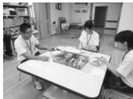
▲作業療法室での体験の様子