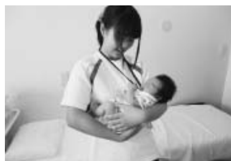
▲赤ちゃんを抱っこする様子

ん、助産師と直接触れ合うことで助産師という専門職の魅力を感じてもらえたのではと期待しています。