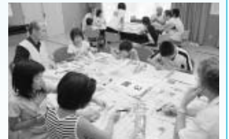
短冊に願いごとを書きました

毎年恒例の「くまっ子交流七夕の集い」がくまっ子見守り隊の主催により、下熊谷交流センターで行われ、下熊谷地区の小学生1年生から6年生までの児童20人とくまっ子見守り隊の会員