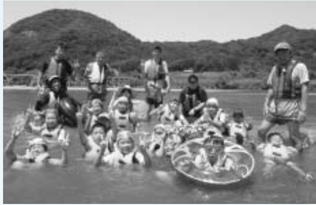
ふれあいキャンプの参加者たち

毎年恒例の「B & G親と子のふれあいキャンプin雲南」が、加茂中央公園ふれあいの丘で8月3日から5日までの2泊3日で行われました。キャンプには、雲南市内外の小学2年生から中学2年生までの16人10組の親子が参加し、テント設営や飯ごう炊飯、カヌー、サバイバルゲームなど普段では体験できない多彩な野外体験活動を通して、親子の絆を深めることができたキャンプとなりました。斐伊川を浮き輪などで下る川流れを体験し、「すごく楽しかった。川には深いところや流れが速いところがあることが分かった」と目を輝かせて話し、自然の面白さ、驚き、怖さなどいろいろな発見ができたキャンプを楽しみました。