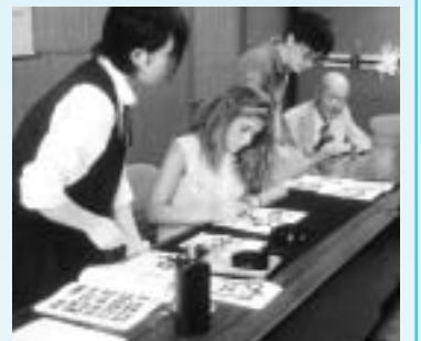
三刀屋高校を訪問し、書道を体験しました

このホームステイは、ライオンズクラブ国際協会の2012夏期青少年交換事業で、他国の人と接する機会を青少年に与えることなどを目的に行われており、今年三刀屋ライオンズクラブが受け入れ、実施されました。