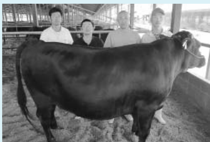
島根県代表に選ばれた星栄号

その結果、第7区（総合 評価群）の肉牛群でJA雲 南吉田肥育センターの「星 栄」号が島根県代表に決定