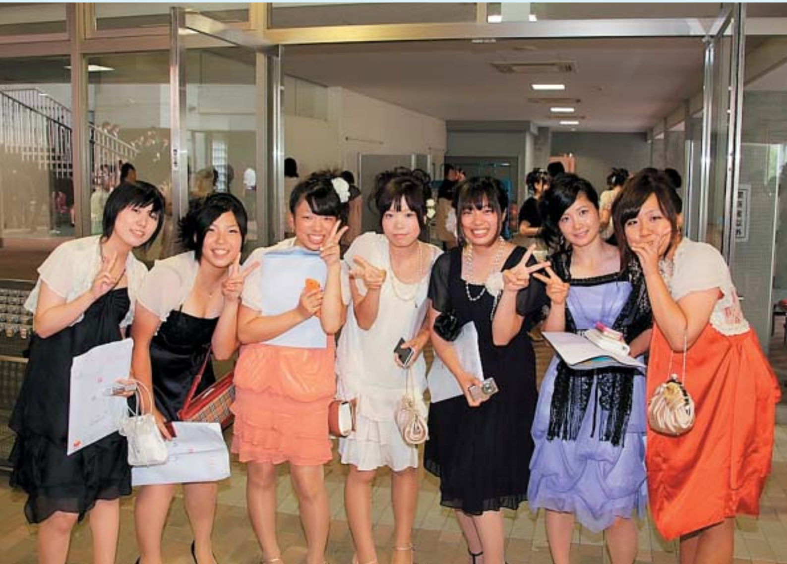
成人式を迎えられた新成人のみなさん(8月15日、三刀屋文化体育館アスパル)