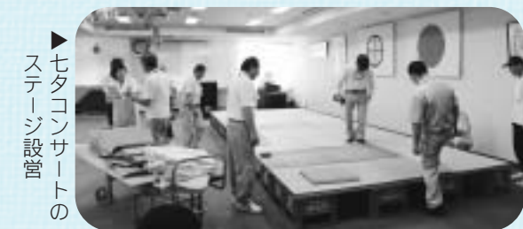
▶七夕コンサートのステージ設営

病院ボランティアの会のみなさまには、病院正面の大笹の設営やスイカちょうちんの飾り付けをしていただき、七夕を盛り上げていただきました。また、七夕コンサートにも参加していただき、前日の飾り付けやステージ設営などの会場準備、当日入院患者さんを会場まで車椅子で介助するお手伝いをしていただきました。