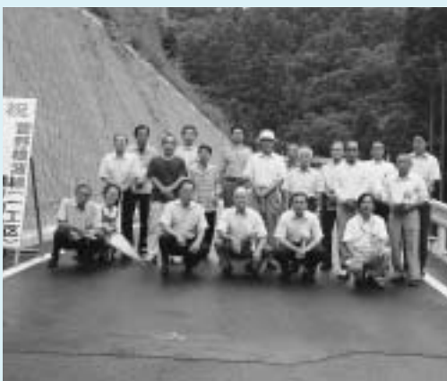
地元関係者が農道1工区の完成を喜び合いました

今回開通の道路では、テープカットを行い、県や市及び地元関係者ら約30人が出席し、通り初めをして完成を祝いました。この農道が完成したことにより、地域農業の振興、農産物等の輸送の合理化、並びに農