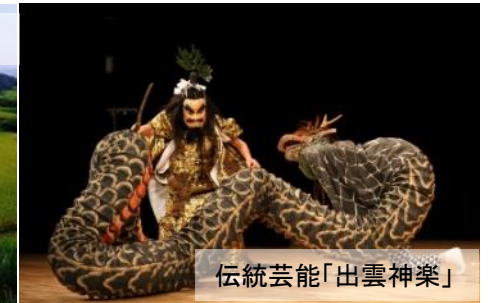
伝統芸能「出雲神楽」