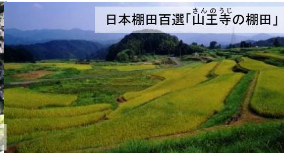
さんのおじ 日本棚田百選「山王寺の棚田」