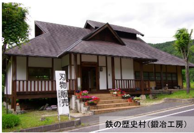
鉄の歴史村(鍛冶工房)