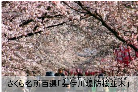
ひいかわていほうさくらなみき さくら名所百選「斐伊川堤防桜並木」

また、ヤマタノオロチ退治を中心とした出雲神話の舞台であるとともに、国宝に指定された銅鐸やたたら製鉄など、地域特有の歴史や文化をもつ地域です。また、農村景観や神楽など、暮らしに根ざした農村文化が豊富であり、日本のふるさとの原点ともいえるべき歴史・文化が息づいています。