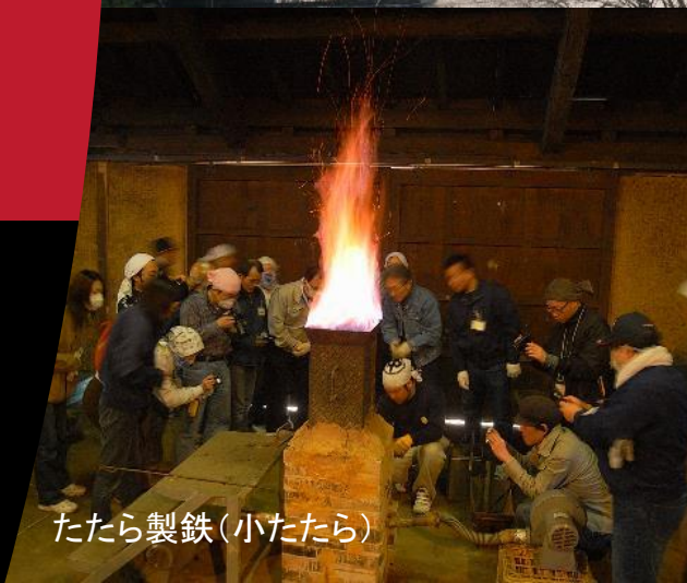
たたら製鉄(小たたら)