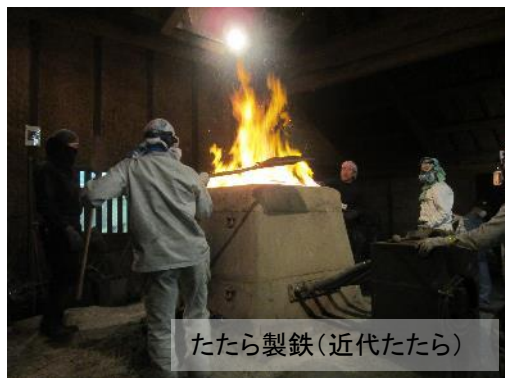
たたら製鉄(近代たたら)

その他、たたら製鉄にまつわる鍛冶体験やガイドの育成などと併せ、関係団体とともに「たたら製鉄」の体験観光の充実を図ります。