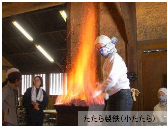
たたら製鉄(小たたら)