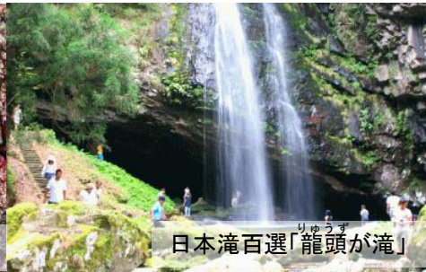
りゅうず 日本滝百選「龍頭が滝」