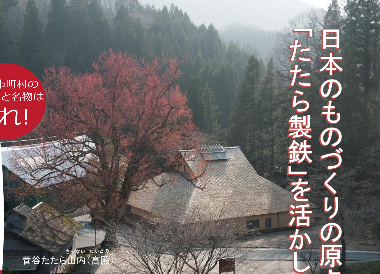
さんない たかどの 菅谷たたら山内(高殿)