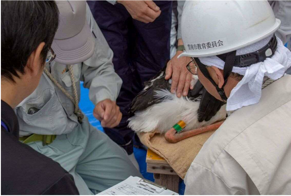
足環装着時の様子①（撮影日：令和元年5月20日）