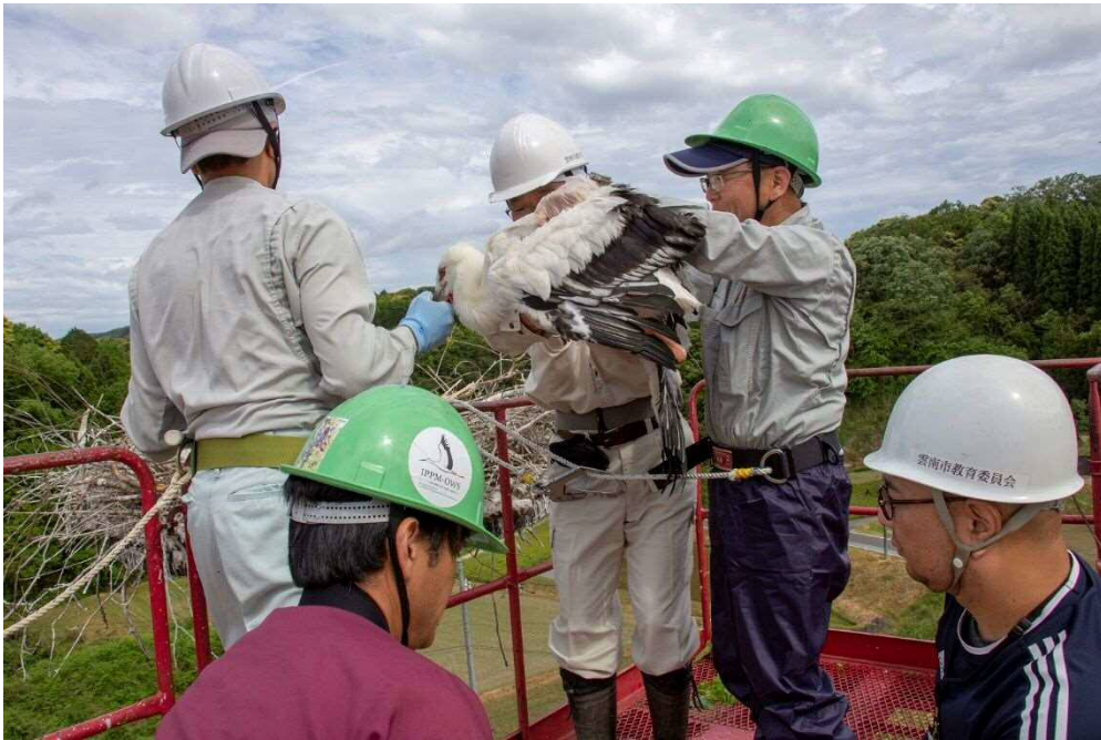
ヒナ捕獲時の様子（撮影日：令和元年5月20日）