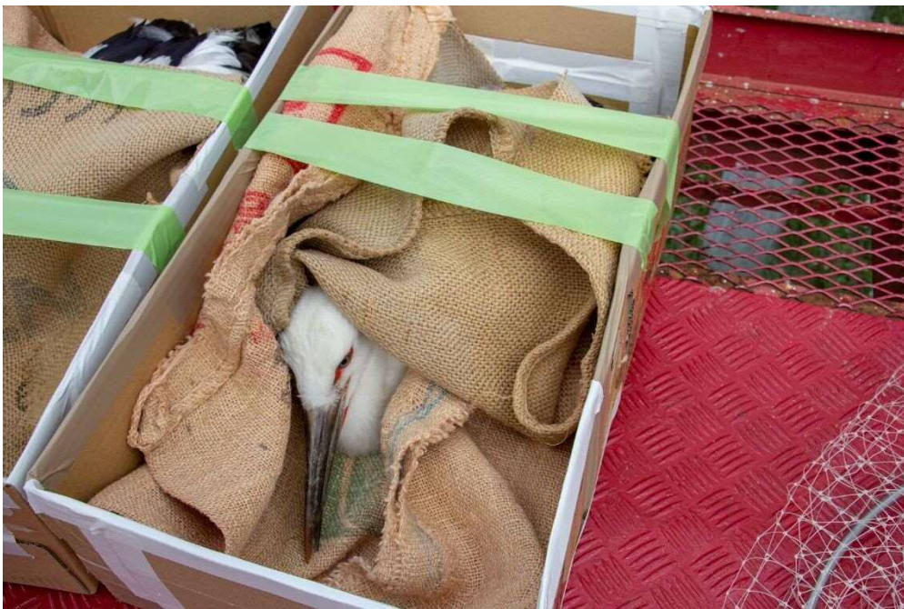
捕獲後のヒナの様子（撮影日：令和元年5月20日）