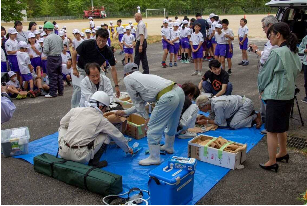
足環装着時の様子③（撮影日：令和元年5月20日）