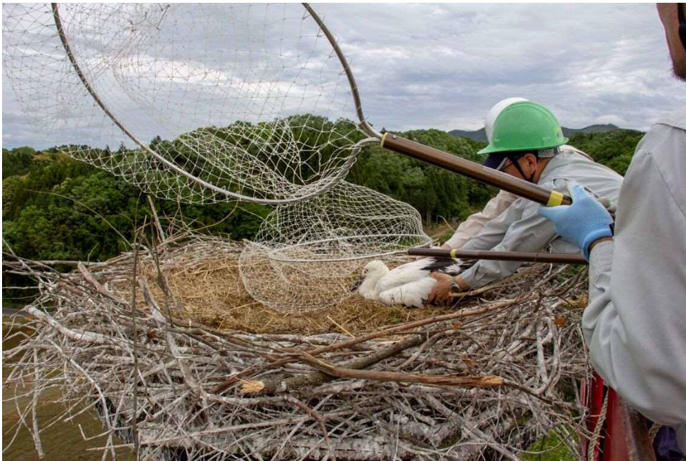
ヒナを巣に戻す様子（撮影日：令和元年5月20日）