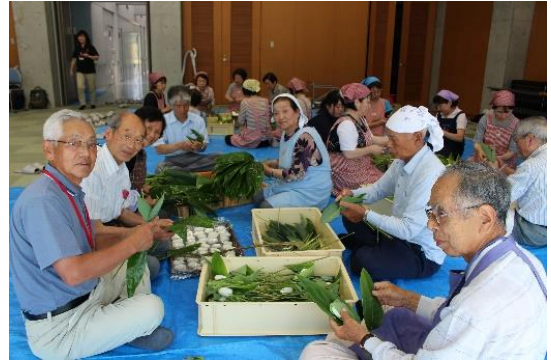
高齢者笹巻き交流会