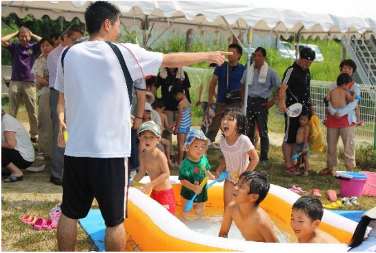
子育て事業の様子