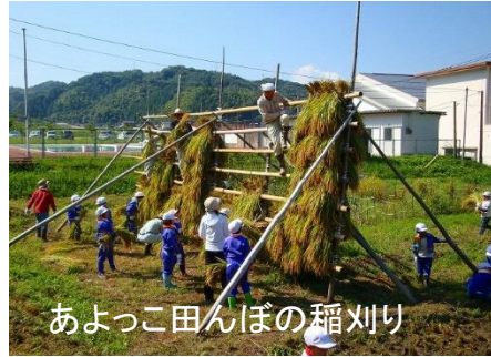
あよっこ田んぼの稲刈り