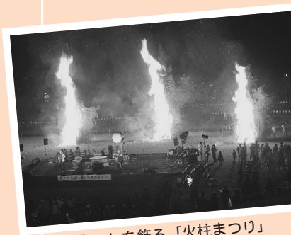
フィナーレを飾る「火柱まつり」