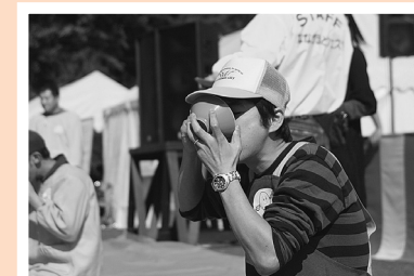
たまごかけごはんりレー