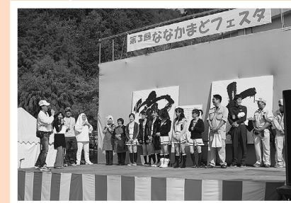
多様なステージイベントを開催