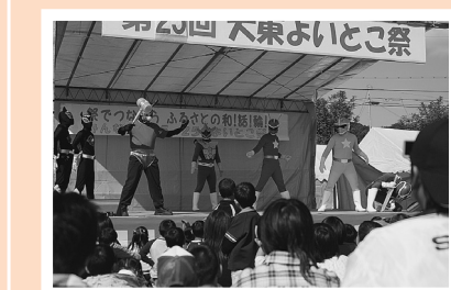
よいとこ戦隊ダイトレンジャー参上