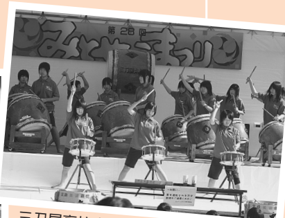
三刀屋高校生による「みどや太鼓」