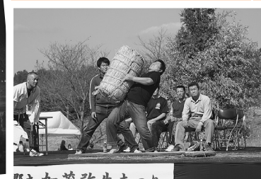
米俵かつぎ大会には力自慢の男女が参加