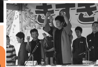
メインイベント 「がっしゅでぎばめ!ウルトラクイズ」