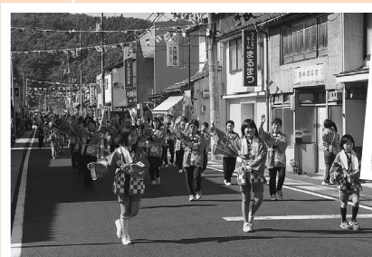
町内を練り歩く「梅が香音頭おどり」の行列