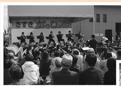
木次中学校吹奏楽部の特別演奏会