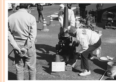
懐かしい焼玉発動機の展示