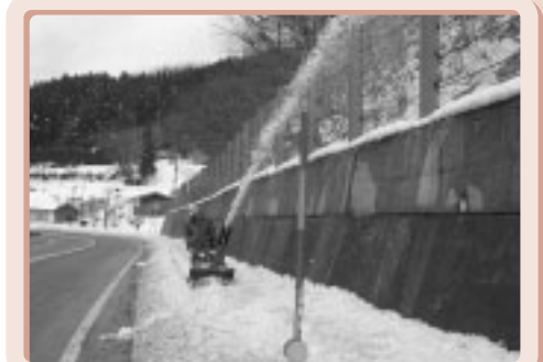
▲自治体による国道54号の歩道除雪